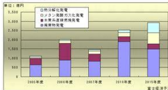
第8回 バイオマス発電プラント市場予測